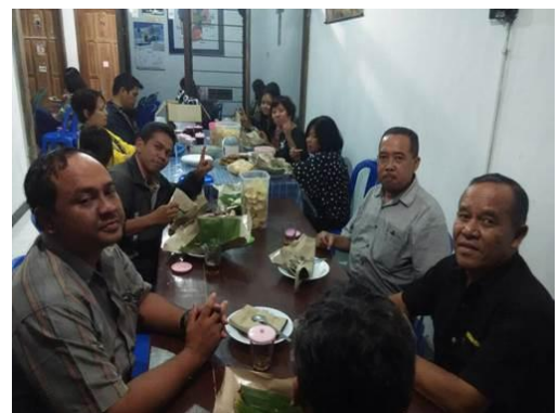
Os líderes de uma pequena região compartilham uma refeição enquanto discutem questões ministeriais que surgiram durante a coleta de dados.

Durante os quatro anos seguintes, à medida que grupos de crentes deram origem a outros grupos, dois aglomerados de grupos ligados tomaram forma, compreendendo 140